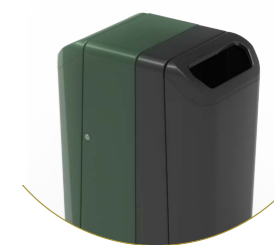
Dulce 70 & 100 set van 2