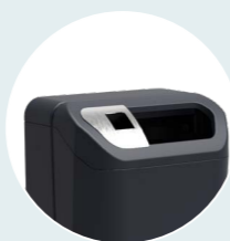
asbak (RVS) links of midden