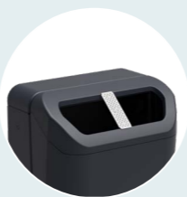
sigaretten uitdrukplaat (RVS)