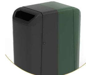
Dulce 100 set van 2