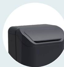
stank- en dierwerende klep