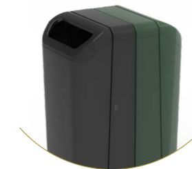
Dulce 70 set van 2

Dankzij de strak afgewerkte achterzijde is de Dulce ook geschikt voor het gescheiden inzamelen van afval.